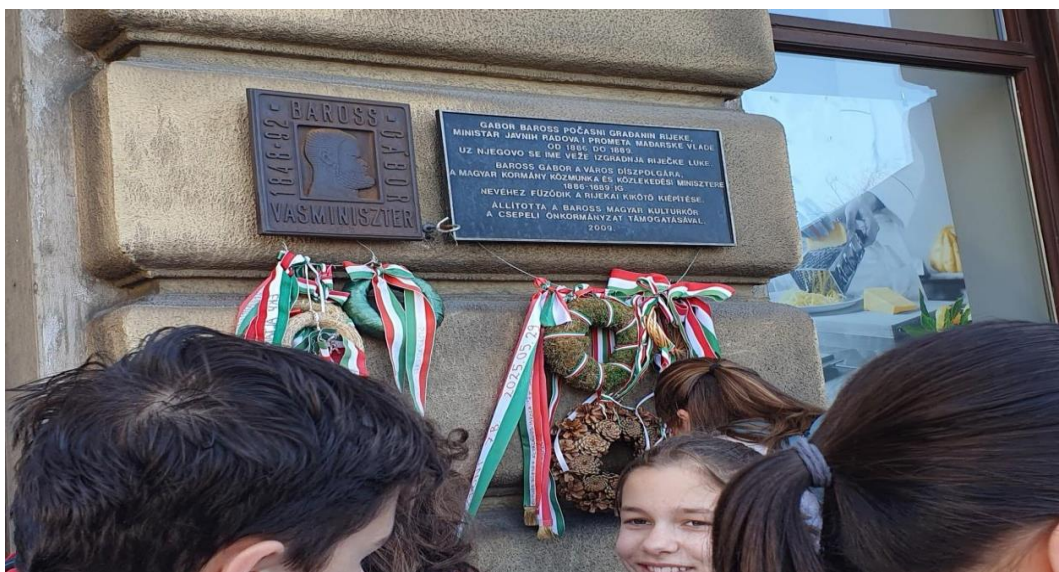
5. nap - Fiumei Szabadállam és Abbazia

Ellátogattunk ahhoz a hídhoz, amely az 1920-1924 között fennálló Fiumei Szabadállam határát jelentette. Megismertük a Szabadállam történetét, amelynek egyik hivatalos nyelve a magyar volt. Ezután Abbáziába utaztunk, a Monarchia korabeli magyar arisztokrácia kedvelt üdülőhelyére, ahol tengerparti sétát tettünk.